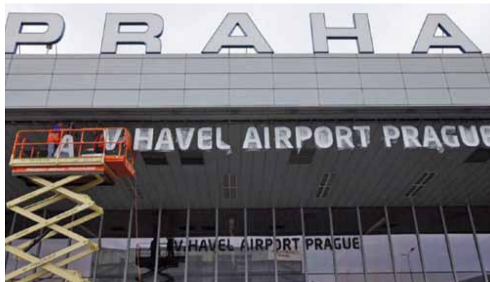
Пражскі аэрапорт афіцыйна названы ў гонар Вацлава Гавэла, былога прэзідэнта Чэхіі, што памёр летась.