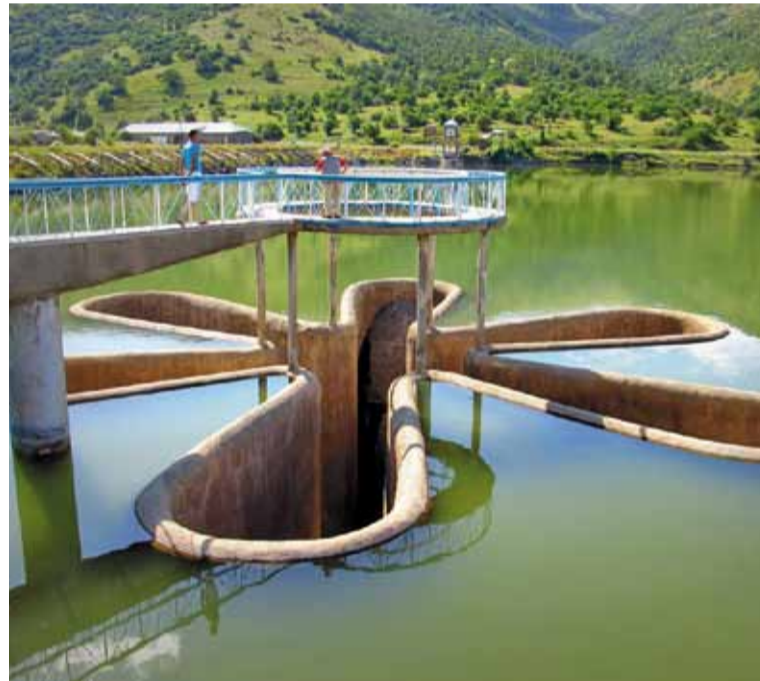
«Маргарытка» — вадаскід 40-метровай глыбіні на сістэме водазабеспячэння Севанскага каскада ГЭС.

Я прыехаў сюды на машыне з вайскоўцамі. Яны просяць не шпацыраваць асабліва па горадзе, бо большая яго частка дагэтуль замініраваная. Дый тут няма чаго глядзець. Адною гільзы пад нагамі і ўзарванага фантана дастаткова. Я разварочваюся і збягаю. На выездзе з горада сядзіць бабуля і просіць грошы. «У мяне няма, — кажу я. — Але ёсць хлеб». «Давай. А ці ёсць вопратка?»