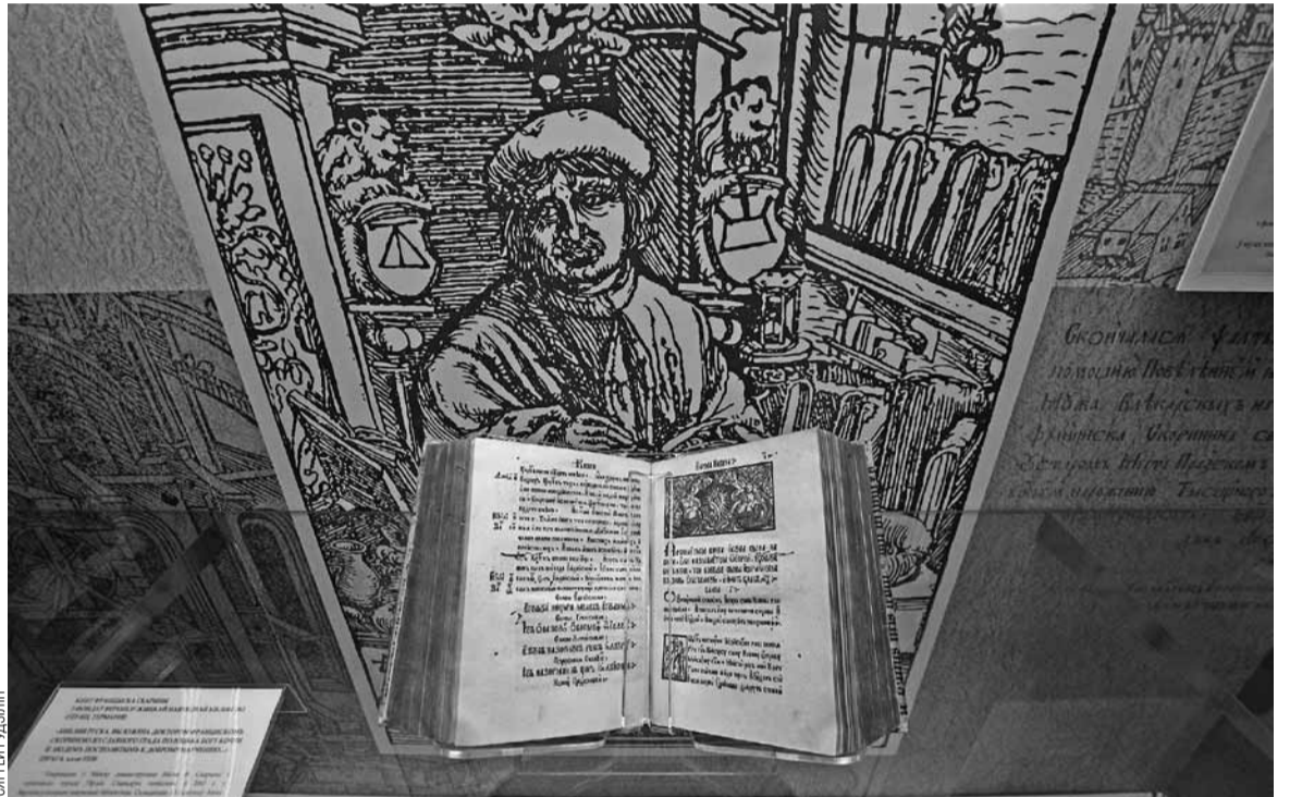
Каб паказаць у Мінску гэты асобнік Скарынавай Бібліі, перамовы вяліся некалькі гадоў.

За стагоддзі старая кніга правандравала праз палову Еўропы, прайшла праз многія рукі. Яе гісторыя ўтрымлівае некалькі дэтэктыўных загадак. Пасля даследавання стала вядома, што канвалют у 1527 належаў тэолагу і дзеячу Рэфармацыі ў Сілезіі Іагану Хесу, які атрымаў яго ў падарунак ад нейкага Андрэаса Бланка. Пра апошняга нічога не вядома. А любыя звесткі пра гэтага чалавека маглі б даць адказ на пытанне, якім чынам Біблія з Прагі трапіла ў Брэслаў (Вроцлаў). Няма звестак і пра тое, дзе кніга знаходзілася пасля смерці Хеса ў 1547. У 1615 яна з'яўляецца ў Гёрліцы. Пра гэта сведчыць адпаведны запіс,