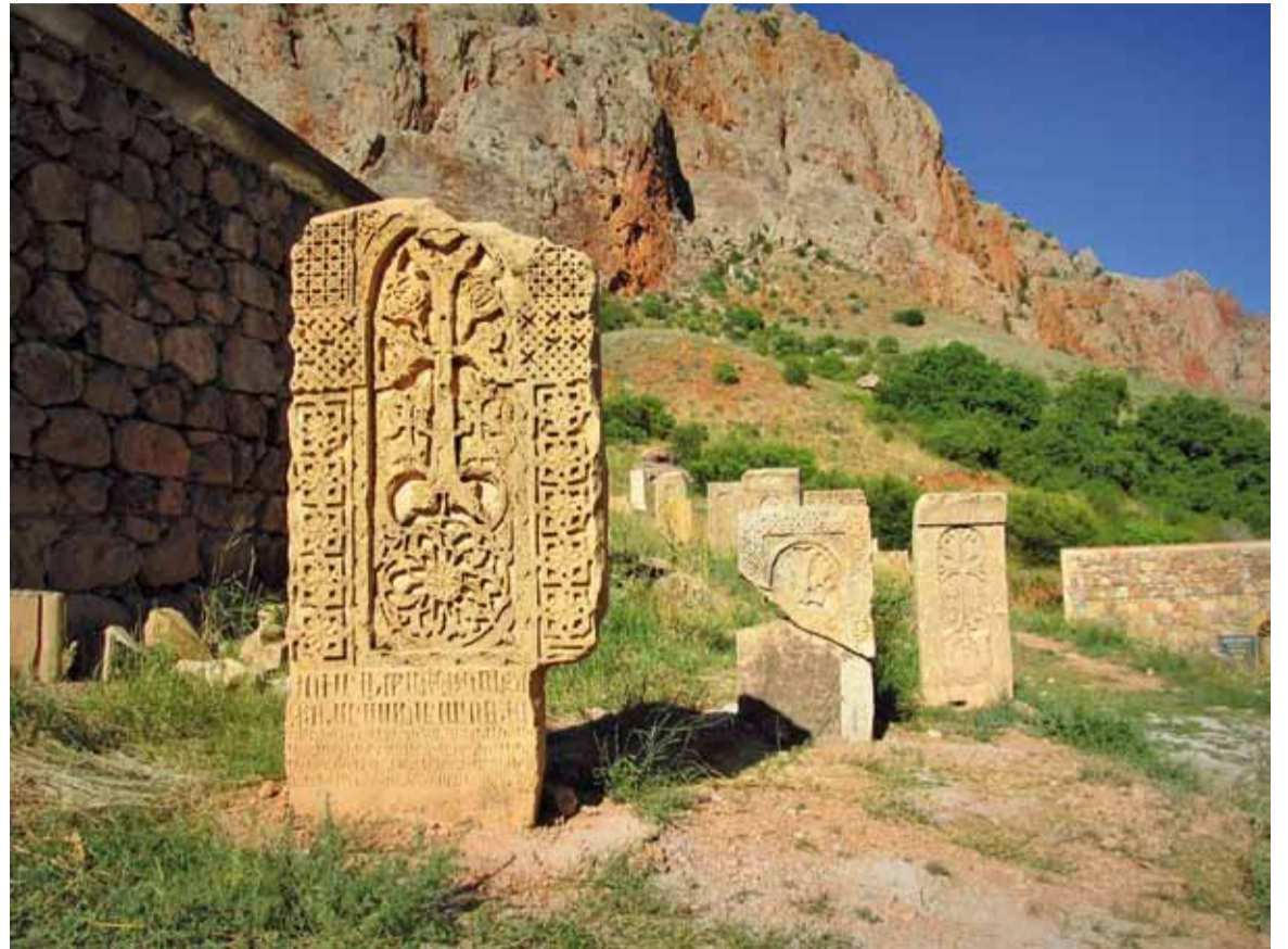
Хачкары — надмагіллі і ўнікальныя творы мастацтва.

Адзіны ацалелы будынак у горадзе — мячэць. Можна падняцца на мінарэт, і тады руіны будуць бачныя да самага далягляду.