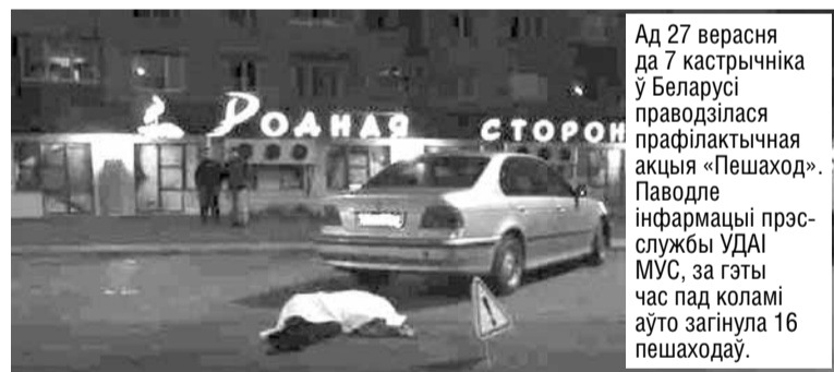
Ад 27 верасня да 7 кастрычніка ў Беларусі праводзілася прафілактычная акцыя «Пешаход». Паводле інфармацыі прэс-службы УДАІ МУС, за гэты час пад коламі аўто загінула 16 пешаходаў.

Даішнікі па слядах на асфальце мяркуюць, што хуткасць «Фальксвагена» на момант здарэння была не меншай за 100 км/г. Хоць сам кіроўца інспектарам хут-