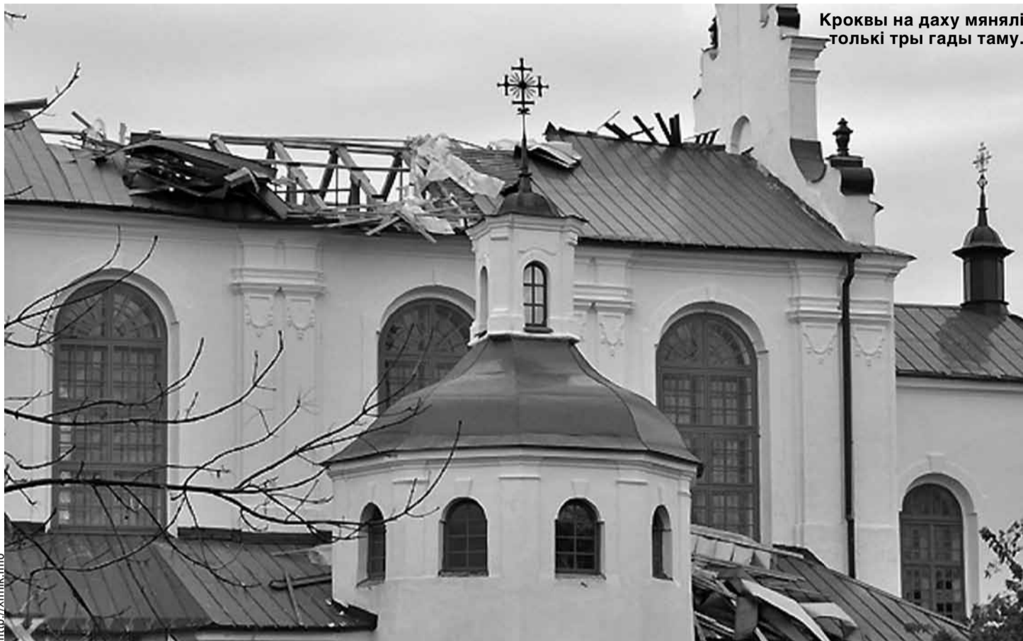
Кроквы на даху мянjalі толькі тры гады таму.