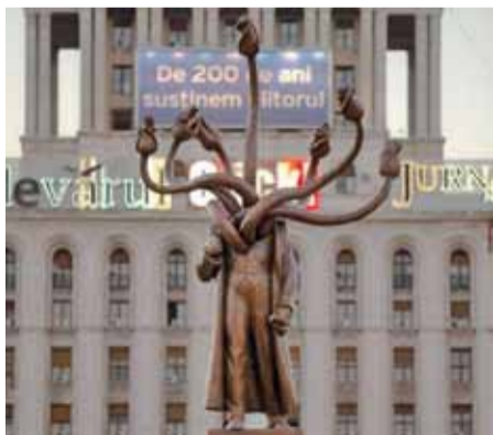
У Бухарэсце на былой плошчы Леніна перад Домам друку наноў адкрылі помнік правадыру сусветнага пралетарыяту. Гэта копія помніка, што стаіць перад МДУ ў Маскве. Цяпер румынскі помнік завецца «Гідра». Толькі замест галаваў там ружы.